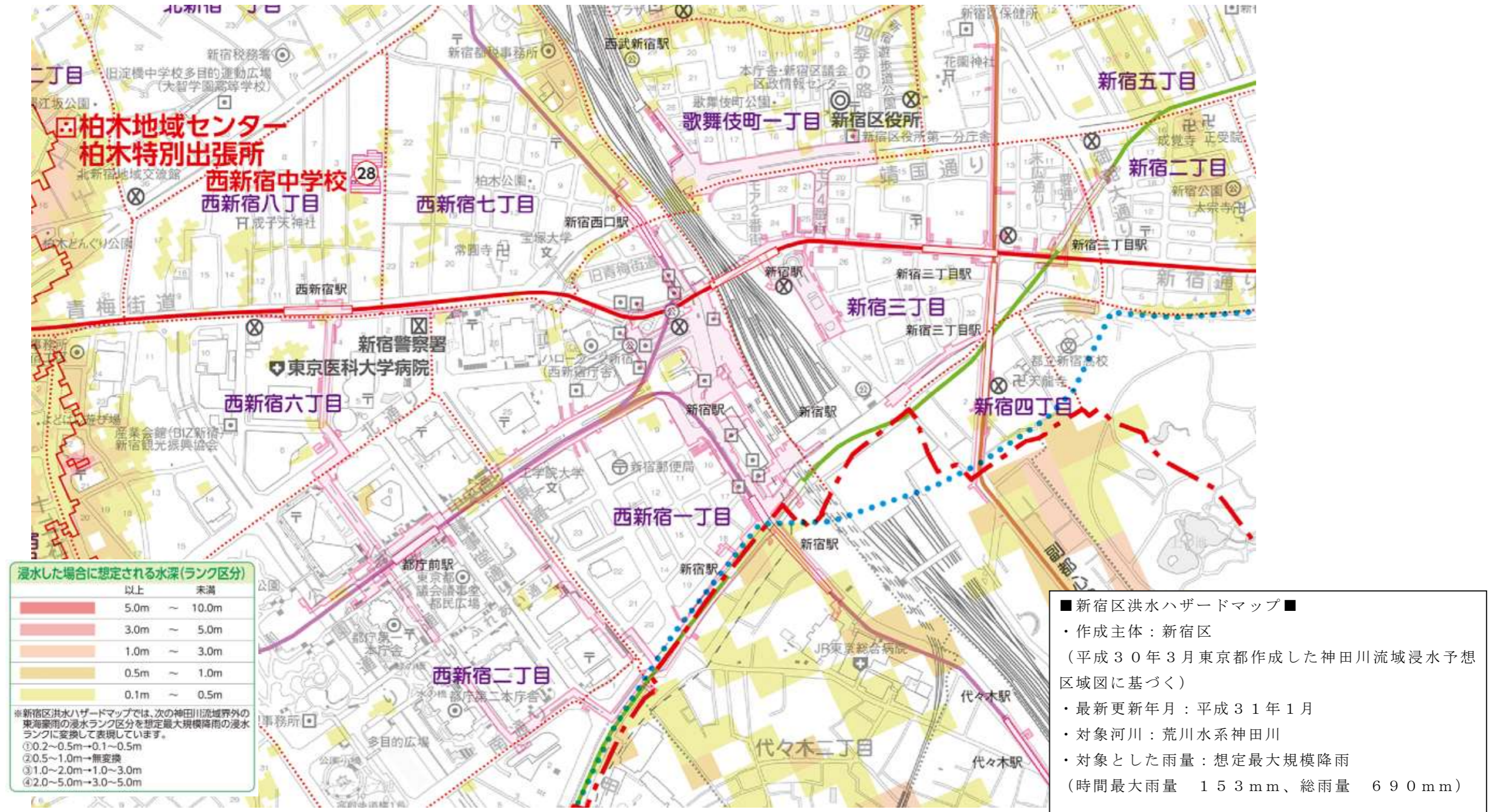
図4 新宿駅周辺の浸水想定区域図(想定最大規模降雨)