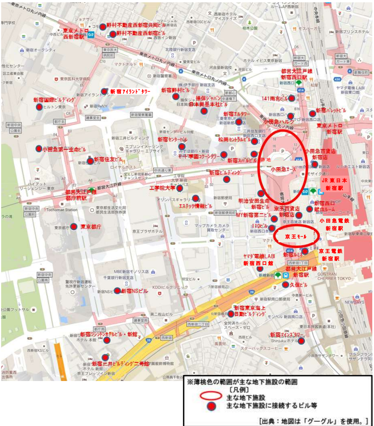
図 3 対象施設