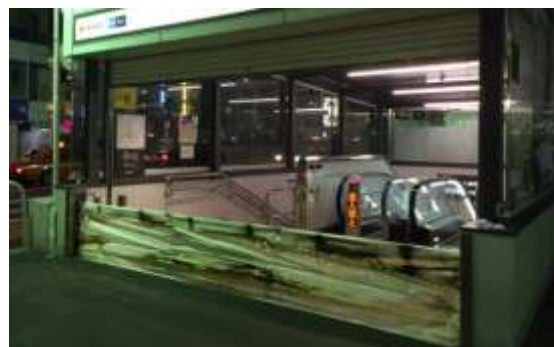
写真 止水板設置例