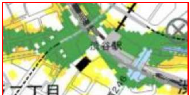
図 4 渋谷駅周辺の浸水想定区域図（想定最大規模降雨）