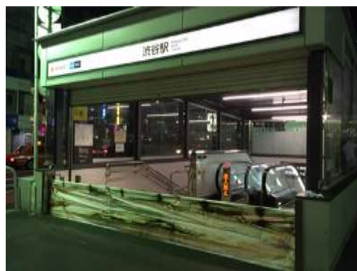
写真 止水板設置例