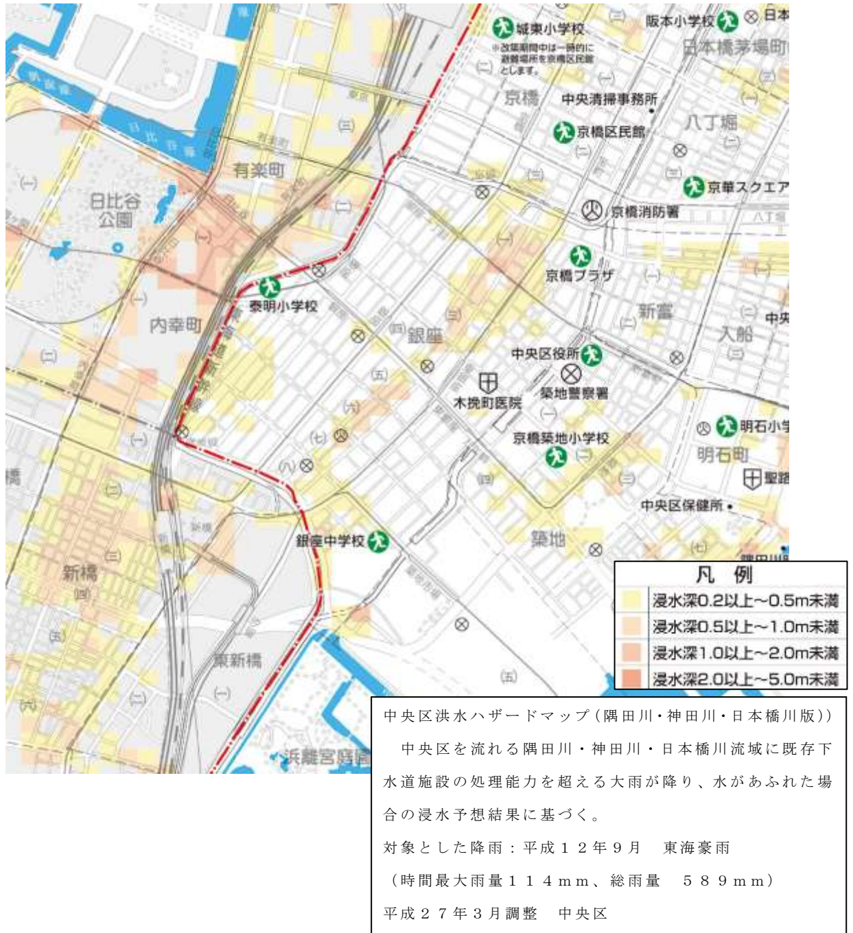
図4 銀座駅、東銀座駅周辺の浸水想定区域図