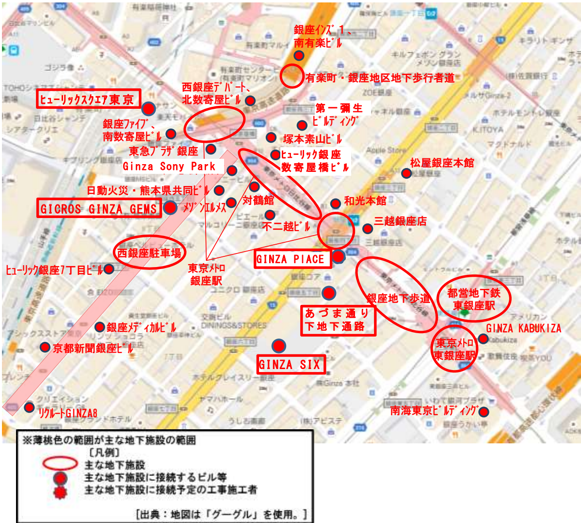
図 3 対象施設