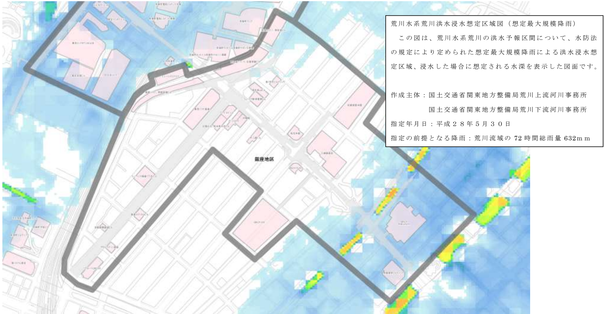
図5 銀座駅、東銀座駅周辺の浸水想定区域図（荒川破堤想定）