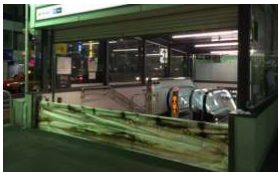
写真 止水板設置例