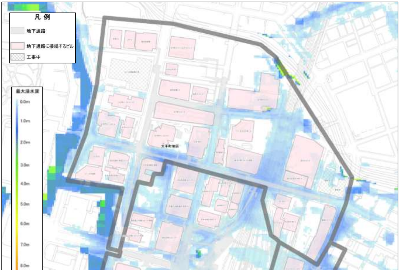
荒川水系荒川洪水浸水想定区域図（想定最大規模降雨）

この図は、荒川水系荒川の洪水予報区間について、水防法の規定により定められた想定最大規模降雨による洪水浸水想定区域、浸水した場合に想定される水深を表示した図面です。