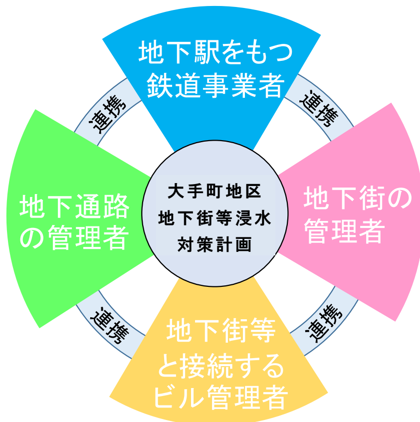
図1 本計画の位置付けイメージ

近年、地球温暖化の進行などにより異常気象が増加傾向と言われている。統計的にも時間50ミルを超える集中豪雨も都内では増加している。また、2019年（令和元年）10月には台風第19号により、都内においても、河川の氾濫や家屋被害など大きな浸水被害を受けた。こうした豪雨から地下施設の利用者や業務従事者の安全を確保し、施設などの被害を軽減するためには地下施設の管理者全てが連携して浸水対策に取り組むことが極めて重要である。